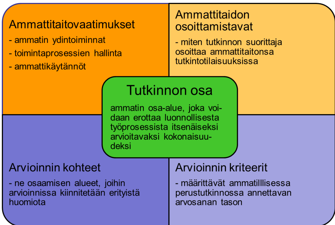
Kuva 1. Tutkinnon osan ja arvioinnin kokonaisuus

Seuraavissa kappaleissa ovat kunkin tutkinnon osan ammattitaidon osoittamistavat. Ammattitaitovaatimukset löytyvät näyttötutkinnon toteutussuunnitelmasta. Arvioinnin kohteet ja arvioinnin kriteerit löytyvät tutkinnon suorittamisen suunnitelma -lomakkeista. Alla oleva kuva selventää, mitä kukin niistä tarkoittaa. Nämä tiedot löytyvät Nuoriso- ja vapaa-ajanohjauksen perustutkinto, nuoriso- ja vapaa-ajanohjaaja 2014 (Määräys 70/011/2014). Tutkinnon suorittajan tulee siis osoittaa ammattitaito siten kuin määräyksessä kerrotaan.